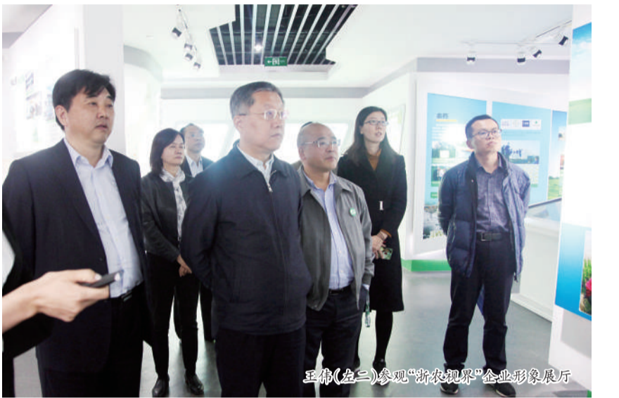
王伟(左二)参观“浙农观察”企业形象展厅

11月22日,中华全国供销合作总社党组成员、理事会副主任(正部长级)王伟率队到浙农控股集团调研,充分肯定了浙农在转变发展方式、创新为农服务和企业文化建设等方面的成绩,同时要求公司坚定“三农”情怀、优化产业结构,融入供销社综合改革试点实践,为加快打造新时代供销社系统标杆企业做出表率。